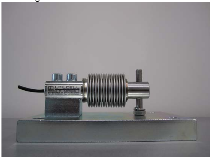
Montaje Placa Base + Célula de Carga + Tornillo de Carga